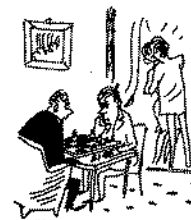
Pas på - Deres dame er i farezonen!!