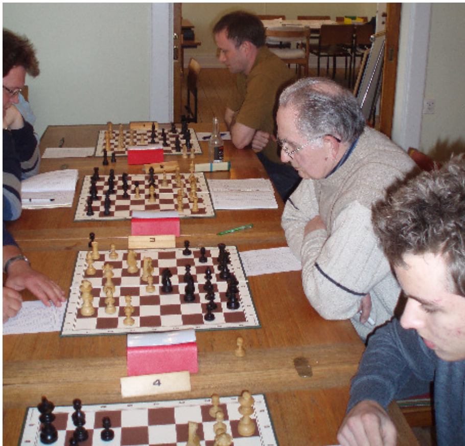
Dyb koncentration ved oprykningskampen mod Sorø.