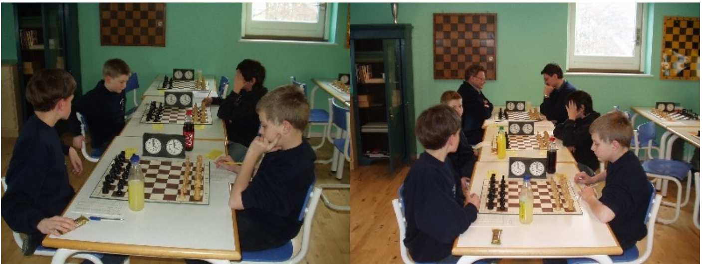
Der er spillere med fra 10 år til 61 år i gruppe 2. / Robin

© 2006 Dansk Skak Union. 2.hovedkreds. Redaktør Jens Lundberg.